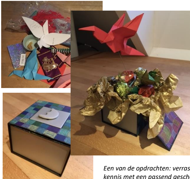
Een van de opdrachten: verras een kennis met een passend geschenk. Maak dit van dingen die je al hebt.

Nu de media ons dagelijks op nieuwe crises wijzen, is vertrouwen in de toekomst belangrijker dan ooit. Maar waarop kunnen we bouwen als de vertrouwde grond wegvalt? Niet op materiële zekerheden of oude spelregels, want die behoren juist tot ons oude leven. Zo markeert elke crisis een drempel. Ervoor liggen rotsvaste zekerheden, erachter verkrumelt de vaste grond en vrezende we een vrije val. Meestal boezemt die chaotische leegte ons zoveel angst in, dat we onze ogen maar liever sluiten. En de drempel mijden, zo lang dit kan.